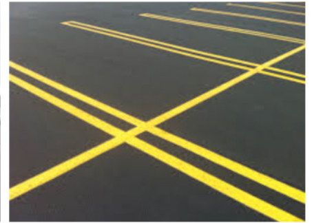
Vastes espaces de stationnement Ample parking space