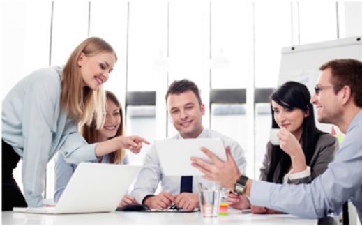
Espaces lumineux et conviviaux Great lighting and user-friendly environment

38, Place du Commerce, bureau 250 Île des Soeurs (Québec) H3E 1T8 intellaimmobilier.com