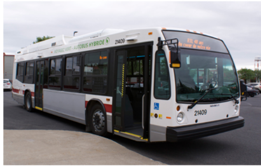
Transport en commun Public transit