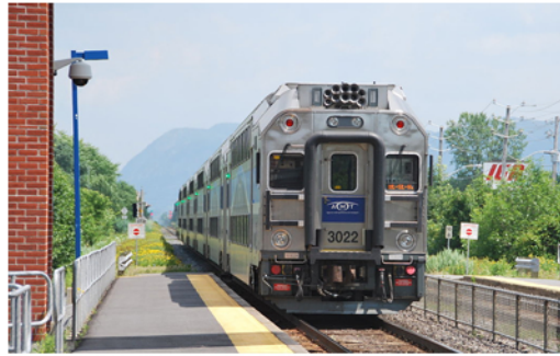
Proche de la Gare Close to train station