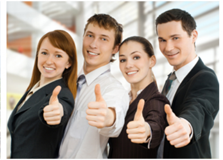
Livraison avril 2018 Delivery April 2018